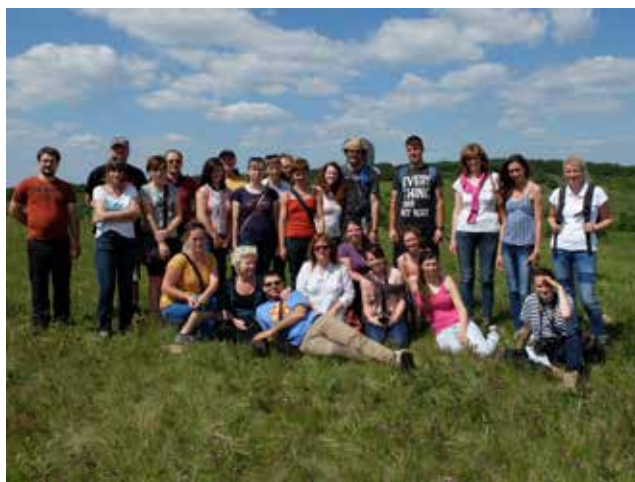
Exkurzi završil výstup na Pouzdřanskou step proslavenou kavylovými porosty. Přírodní step byla krásnou tečkou za doposud navštívenými lokalitami, které mají přírodu za vzor a snaží se jí přiblížit.