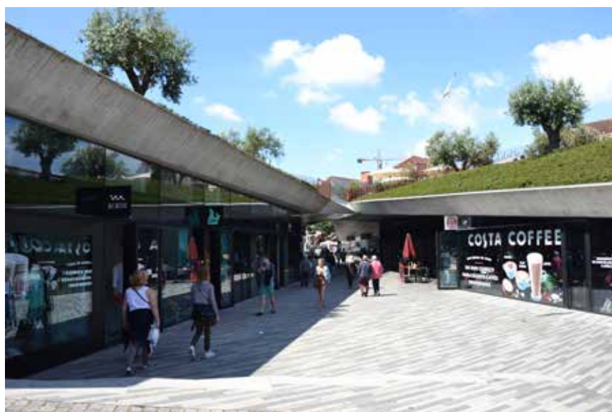
Nejzajímavější střecha, kterou jsme navštívili při exkurzi, byla střecha na Praça da Liberdade (z roku 2012), což je náměstí, které spojuje významné monumenty v Portu. Ve svažitém terénu jsou postaveny podzemní garáže s navazujícími obchody. Celá konstrukce je pokryta intenzivní zelenou střechou s dominujícími olivovníky starými několik desítek let, které byly na střechu přivezeny z jižního Portugalska.