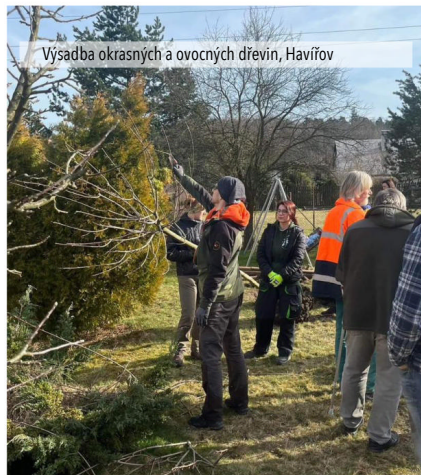
Výsadba okrasných a ovocných dřevin, Havířov

V případě, že byste se chtěli proškolit ve Vámi vybraném tématu a v nabídce ho nemáme, nebo uspořádat nějaké celofiremní školení, neváhejte a kontaktujte nás.