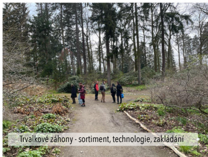
Trvalkové záhony - sortiment, technologie, zakládání

20.4. Trvalkové záhony - sortiment, technologie, zakládání... PREZENČNĚ (PRŮHONICE)