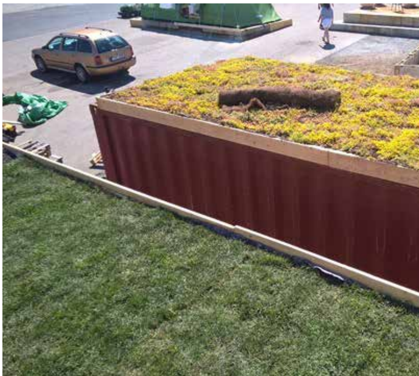
Rozchodníkové koberce na ozelenění střechy kontejneru v rámci Landscape festivalu Plzeň 2017 dodávala naše obchodní firma Sedum Top Solution s.r.o.

V letošním ročníku soutěže ZELENÁ STŘECHA ROKU 2018 připravujeme inovaci. Zaregistrovali jsme doménu www.zelenastrecharoku.cz . Po celý rok až do nominací děl následujícího roku, budou na této stránce prezentována všechna přihlášená díla daného ročníku (bez ohledu na to, zda v soutěži budou oceněna či ne), s uvedením projektanta, realizátora, případně dalšího zhotovitele. Doufáme, že takováto možnost publicity přiláká k přihlášení více děl, i takových, která nejsou výjimečná, ale jsou kvalitně zhotovená a mohou sloužit jako dobrý příklad podpory navrhování a realizace zelených střech na rodinných či obytných domech, sídlech firem apod.