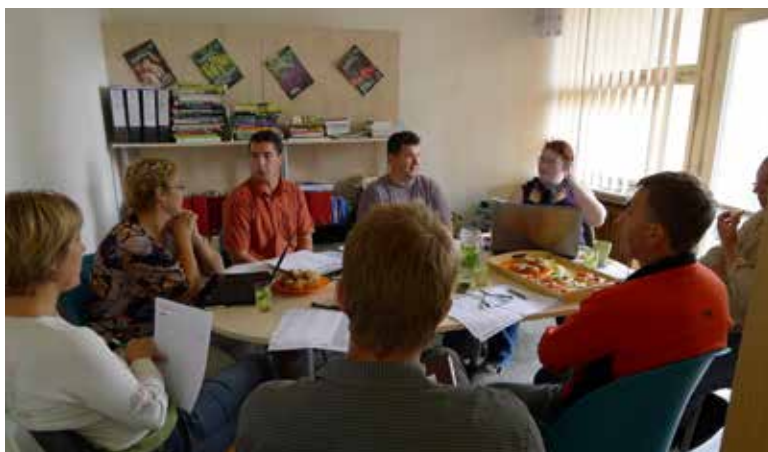
V roce 2011 byla pořadatelem kongresu ABAJ (České Budějovice). Archivní foto z organizační schůzky.

Na kongres je možné se přihlásit na stránkách akce: www.iob-kongress.com . Na těchto stránkách najdete i podrobný rozpis přednášek.