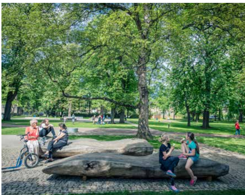
Park roku 2017 – Jiráskovy sady v Litoměřicích