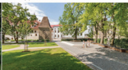
Vrchlického sady, Klatovy