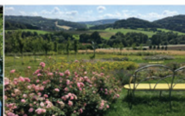
Lesopark Skalky, Nový Jičín