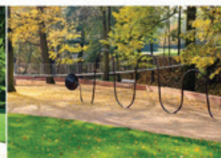
Nábřeží řeky Loučné, Litomyšl