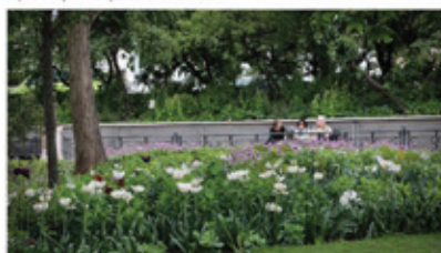
Čelakovského sady, Praha