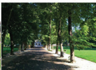
Masarykovy sady, Louny