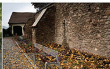
Park pod kostelem, Tišnov