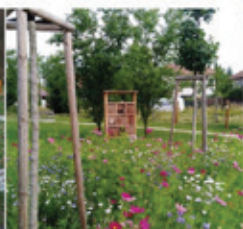
Veliskova zahrada, Zlín Malenovice