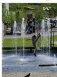
Park Waltrovka, Praha