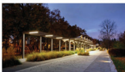
Tyřovky sady, Pardubice