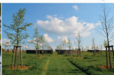
Hřbitov, Dolní Břežany