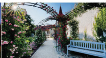
Práhonický park, Práhonice