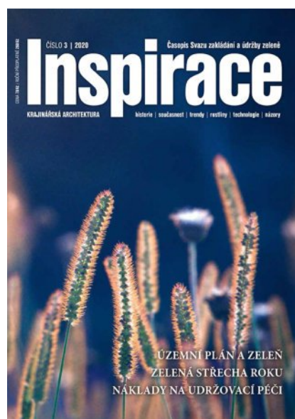
Titulka prvního vydání z roku 2005 a nejaktuálnějšího vydání roku 2020