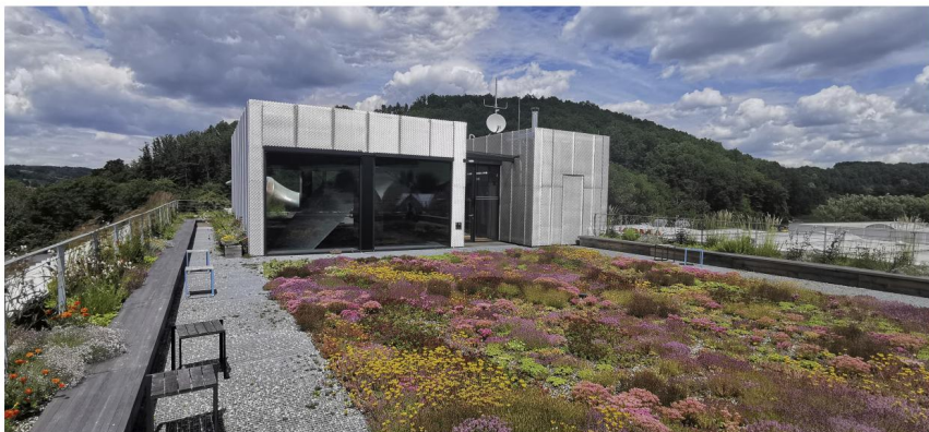
Zelená střecha na nejdejší českém pavilonu nabízí posezení a bylinkovou zahradu s výhledem na areál firmy KOMA MODULAR, přírodu i Vizovice.

A nakonec, když covid dá, oslavíme i těch dvacet let od vzniku našeho vašeho Svazu zakládání a údržby zeleně. Třeba i s nějakým překvapením!