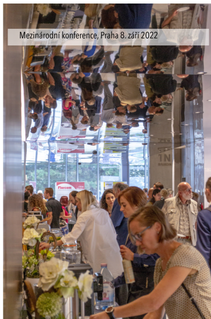
Mezinárodní konference, Praha 8. září 2022

Mezinárodní konference 8. září přivedla do Prahy čtyři zahraniční odborníky, které doplnili přednášející z České republiky. Hlavním cílem konference bylo zvýšit informovanost odpovědných zástupců samospráv a úředníků státní správy ve městech a obcích, stejně jako odborné veřejnosti, o nových trendech v oblasti ozeleňování střech a stěn budov, které jsou jedním z adaptačních opatření na změnu klimatu. Konference byla určena pro zástupce státní správy, samosprávy, projektanty, stavební a zahradnické firmy, developery působící v Praze a zúčastnilo se jí 175 návštěvníků.